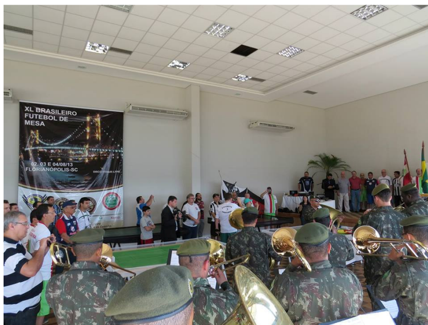
Banda do Exército do 63 BI

Iniciada a competição, as mesas tiveram jogos com alto nível técnico, onde a vontade e concentração de alguns atletas novos contrastavam com a técnica de outros atletas veteranos, criando um inesperado equilíbrio em determinadas partidas, prendendo a atenção dos que ali estavam assistindo e competindo.